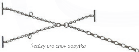
Řetězy pro chov dobytka