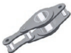
Řetězy do lisů

Příklady válečkových zemědělských řetězů: