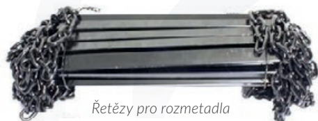
Řetězy pro rozmetadla

Příklady článekových řetězů pro zemědělství a chovatelství: