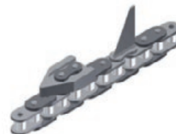
Speciální řetězy do zemědělských strojů