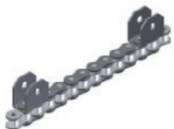
Stroje pro sběr borůvek