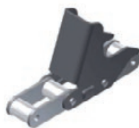
Stroje pro sběr kukuřice